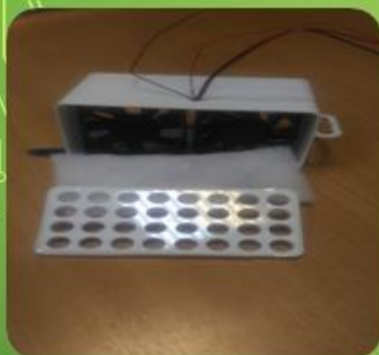
Вентилятор с фильтром