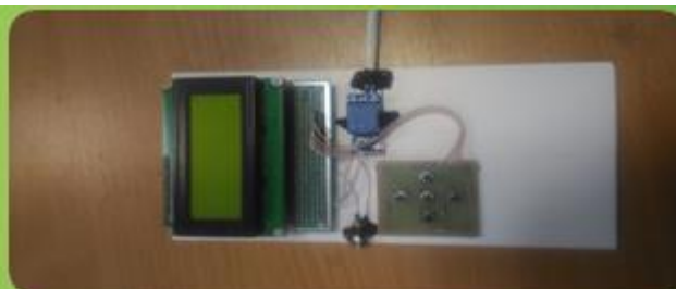
Блок управления (по таймеру)